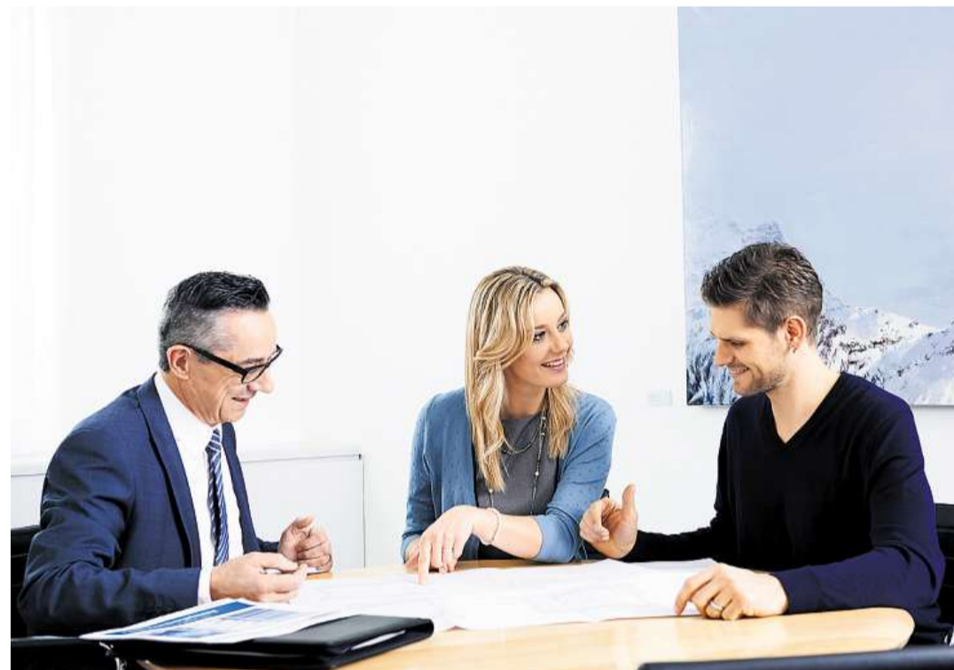
Eine Investition in Immobilienfonds lohnt sich. Ihr Berater zeigt Ihnen gern die verschiedenen Möglichkeiten auf.